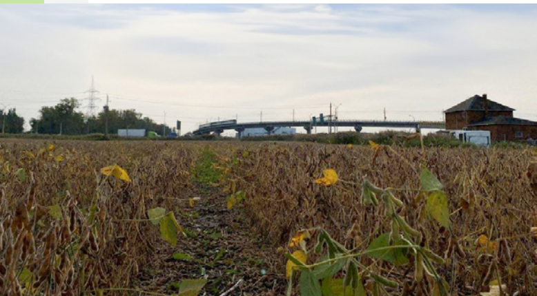
Propriété de la Fiducie à Brossard