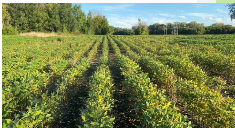
Propriété de la Fiducie à Carignan

Enfin, les trente-quatre voisins de la propriété de Carignan ont été informés des projets de la Fiducie agricole REM et des conventions ont été signées avec douze d'entre eux afin de leur permettre de fréquenter les parties non cultivées de la propriété, comme l'ancien propriétaire leur permettait.